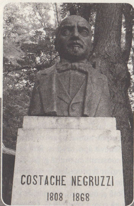
Bustul lui Costache Negruzzi din Parcul Copou, Iași

lui datează din anii 1830. Începutul la Zoe este balzacian, cum va fi și al Misterelor Parisului al lui Sue, din care se vor inspira mai toate romanele noastre de început. O alergare de cai este o mică bijuterie de precizie tehnică. Aspectul e de ficțiune memorialistică. Nuvela lui Negruzzi înfățișează un exemplu de intertextualitate și de alternare a registrelor stilistice neobișnuit în proza epocii. Nuvela Alexandru Lăpușneanul este un clasic al genului, citită de noi toți încă din școală și prețuită de toți istoricii literari, în pofida abuzului de convenții narrative caracteristice epocii. Istoricii au avut mereu probleme cu definirea facturii prozei din Negru pe alb . Ne-a scos din impas Biedermeier -ul, din bagajul căruia fac parte scrisorile, adevărate sau false, notele de jurnal, amintirile, portretele (între care acela al caraghiosului Daniil